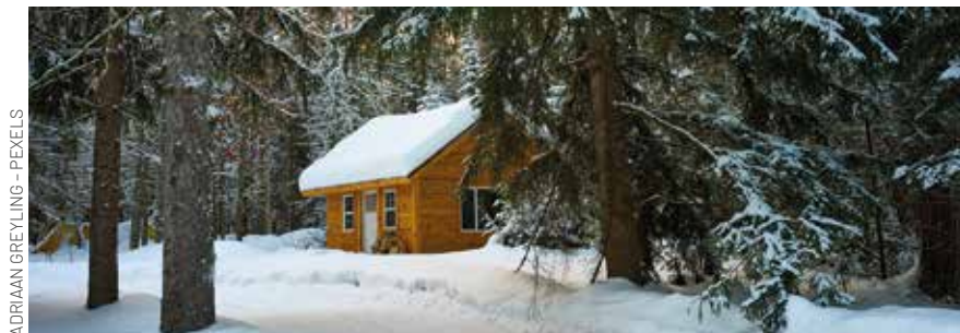
ADRIAAN GREYLING - PEXELS